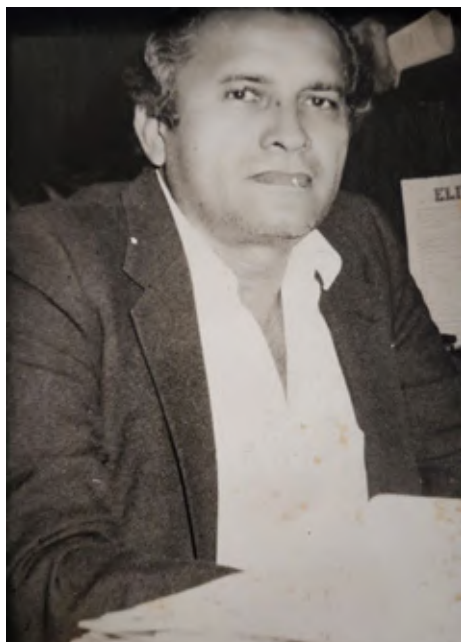
F. S. R. en 1988.