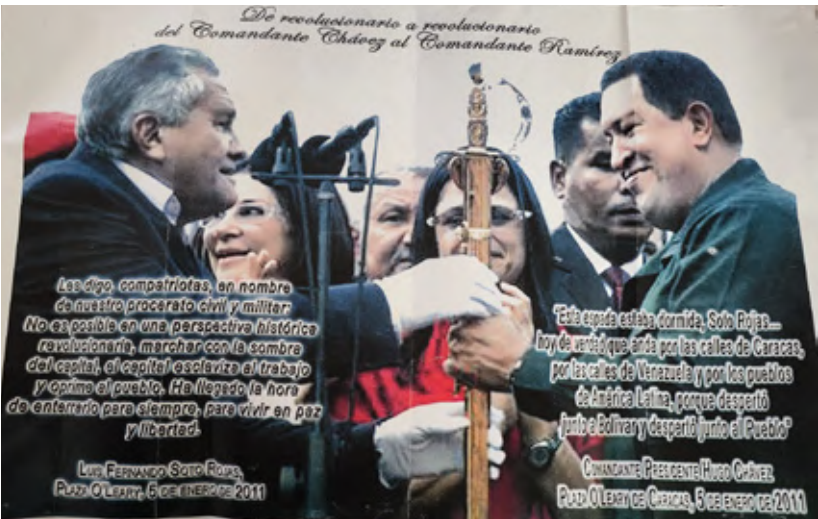
Palabras en el acto en la plaza Simón Bolívar.