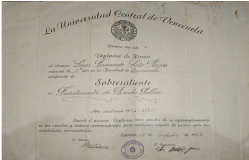
Diploma de honor 1954-1955, UCV.