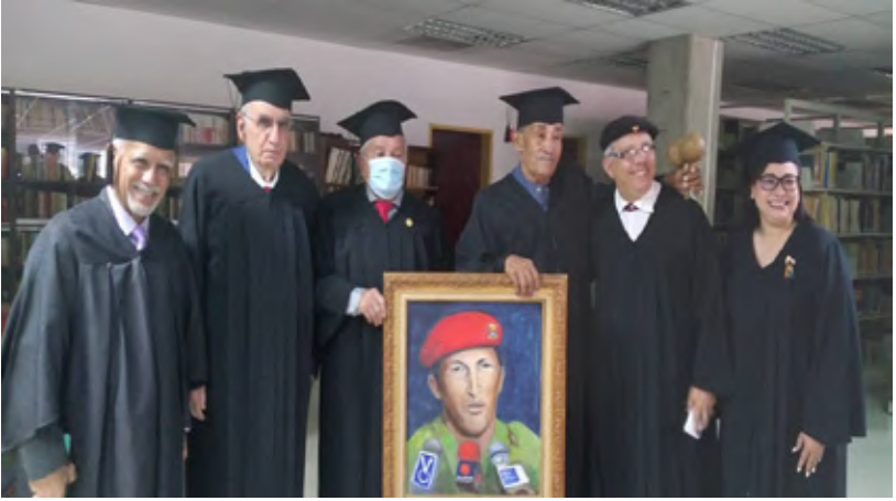
Titulo Doctor Honoris Causa otorgado por la Unesr, 18-06-2023.