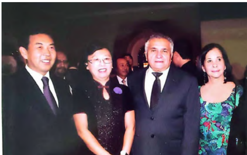
Con el embajador chino, Li Baorong, 2011.