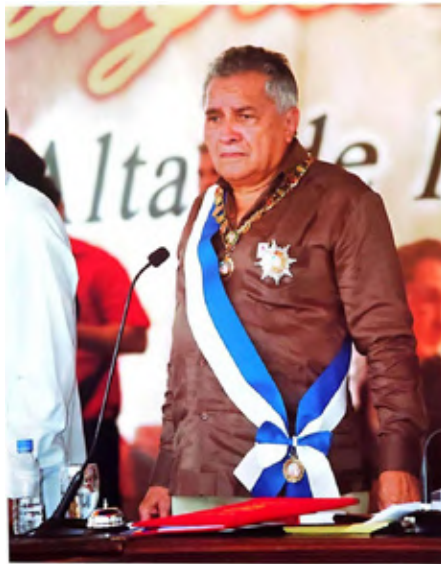
Cabimas, Zulia, 9-12-2017.