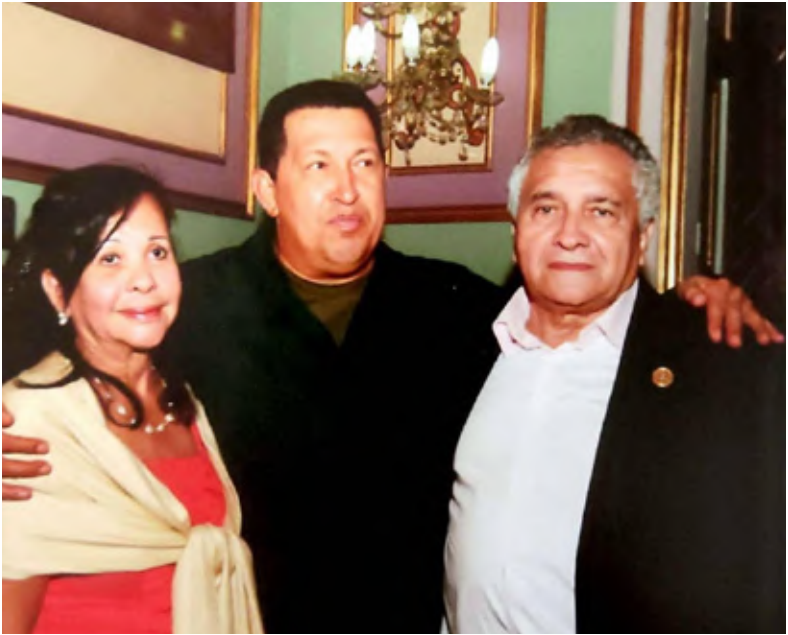
Palacio de Miraflores, enero de 2011.