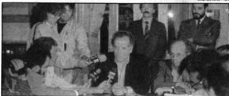
El Presidente en Miraflores desorientado, sin poder ni control de las Fuerzas Armadas; Eduardo Fernández es el copiloto de la caída del avión de CAP...

¡Malditas sean las minas y las libranzas, y los que gastan sin tener con qué!