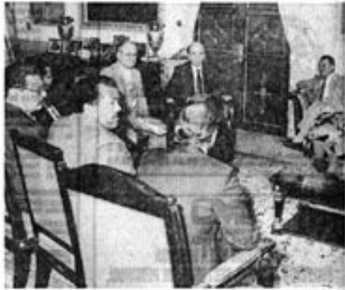
CAP reconoció ante los periodistas los excesos policiales y prometió que no se repetirán

En Afraflor se constituyó la Comisión Asesora del Programa de Inmigración Selectiva. La intención del programa, según Cordillón, es entriquer la fuerza laboral venezolana y lograr transferencia de tecnología de la ex Unión Soviética y Europa