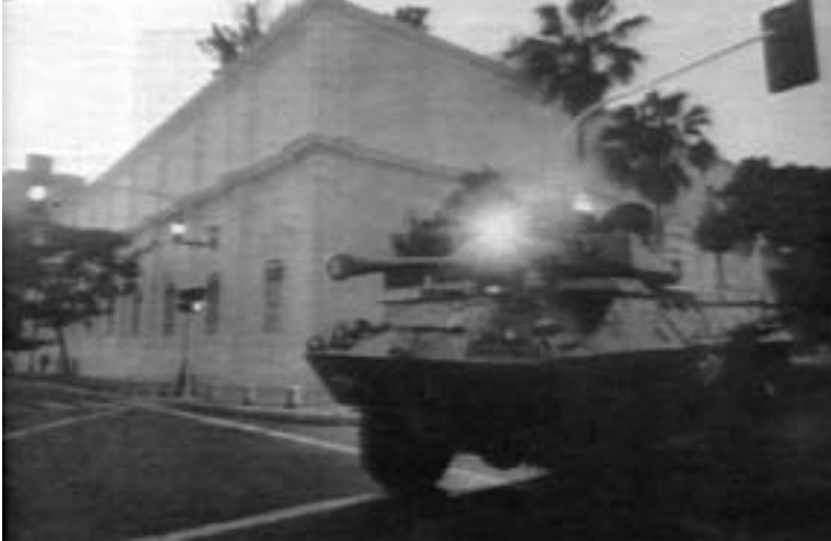
El tanque que golpea: el camino del sur, la esperanza de la unidad continental que proponía Simón Bolívar ahora en el corazón de América Latina

La verja cruje, el tanque de guerra con su barriga de fiera rompiendo los flancos del pillaje: horizonte de relámpagos, fuego y humo esparcidos en el abismo delirante.