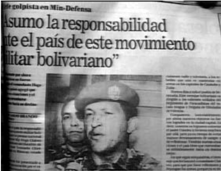
Por primera vez un líder asume la responsabilidad de sus actos a casi un siglo... en un mundo de politiqueros que siempre viven diciendo: 'Yo no fui'...