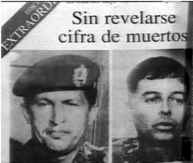
Titular de los diarios con las figuras de los mayores líderes del 4-F...

Las armas que tú tengas debes saber usarlas y tienes que apartarte totalmente de los libros y de las fórmulas de las academias.