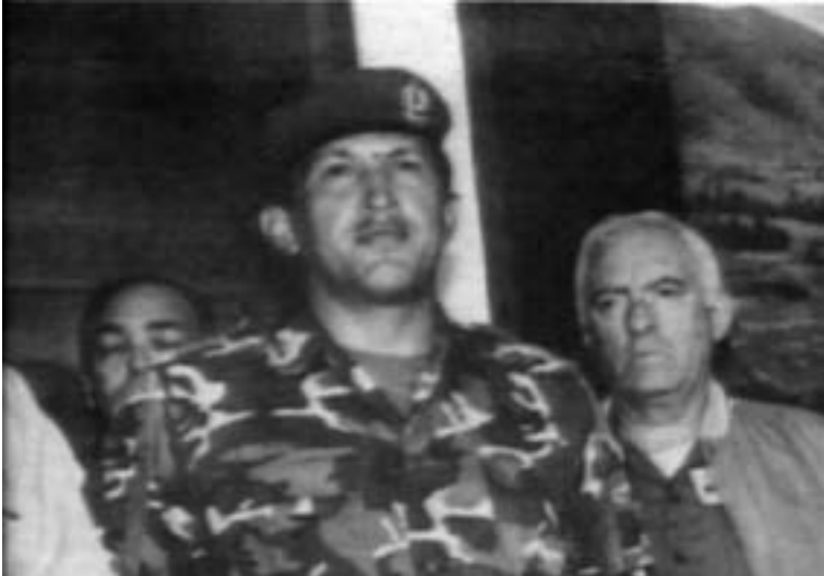
Momento en que Chávez lanza su esperanzador llamado a las fuerzas rebeldes, mundialmente televisado y que se dará desde Fuerte Tiuna. Un misil pulverizador de la derecha que dura un minuto y veintisiete segundos...