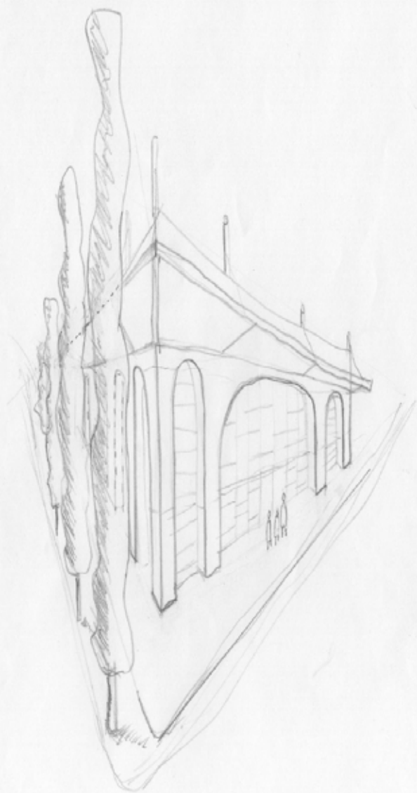
Fachada Escuela de Titeres José Elcure / Ezequiel Arangó